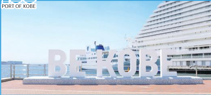
人気フォトスポット「BE KOBE」モニュメント

メリケンパークは、神戸開港120年(1987年)に合わせて完成した公園で、近傍に神戸ポートタワーや神戸海洋博物館を有し、みなと神戸を代表するウォーターフロントの公園です。神戸開港150年を契機に、芝生広場が広くなり、西日本最大級のスターバックスコーヒーも園内にオープン。夜もLED照明やカラーライティングで公園全体をライトアップし、昼も夜もにぎわい楽しめる公園にリニューアルしました。