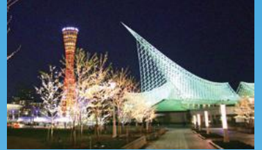
夜のメリケンパーク

メリケンパークは、神戸開港120年(1987年)に合わせて完成した公園で、近傍に神戸ポートタワーや神戸海洋博物館を有し、みなと神戸を代表するウォーターフロントの公園です。神戸開港150年を契機に、芝生広場が広くなり、西日本最大級のスターバックスコーヒーも園内にオープン。夜もLED照明やカラーライティングで公園全体をライトアップし、昼も夜もにぎわい楽しめる公園にリニューアルしました。