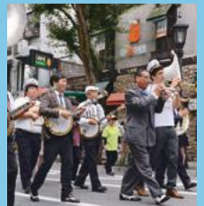
昨年のパレードの様子